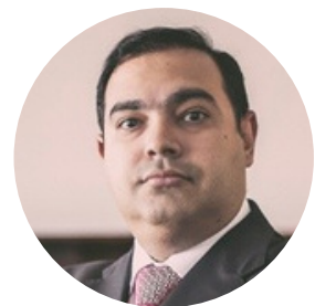
MARCO BRUNO MIRANDA CLEMENTINO - JUIZ FEDERAL - JFRN MEMBRO DO CENTRO NACIONAL DE INTELIGÊNCIA DA JUSTIÇA FEDERAL E DO COMITÊ NACIONAL DA CONCILIAÇÃO DO CNJ.