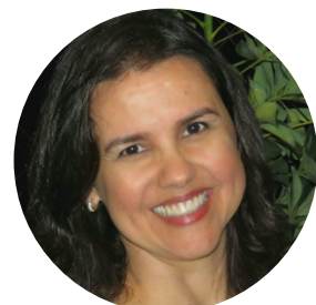
POLYANA FALCÃO BRITO - JUÍZA FEDERAL DA JFPE E MEMBRO DO COMITÊ DO PJE NA 5ª REGIÃO E DO COMITÊ NACIONAL DE PJE DA JUSTIÇA FEDERAL